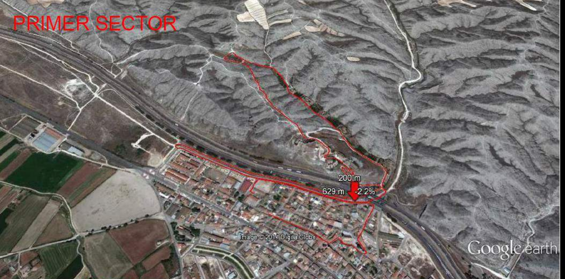
Gráfico: min., media, máx. Elevación: 191, 212, 255 m Total de intervalo: Distancia: 4,75 km Incremento/pérdida de elevación: 107 m, -108 m Pendiente máxima: 24,1%, -21,8% Pendiente media: 4,3%, -4,1%